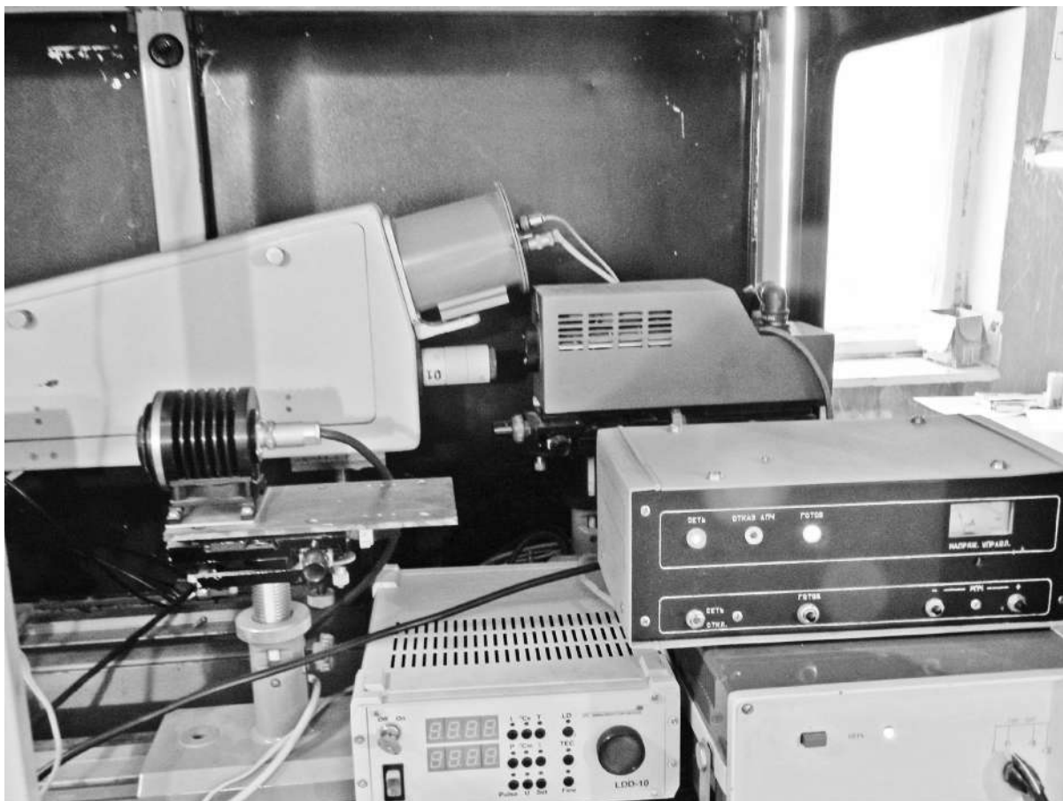
Рис. 3. Установка для повірки дозиметрів лазерного випромінювання на довжинах хвиль 0,63 і 0,8 мкм