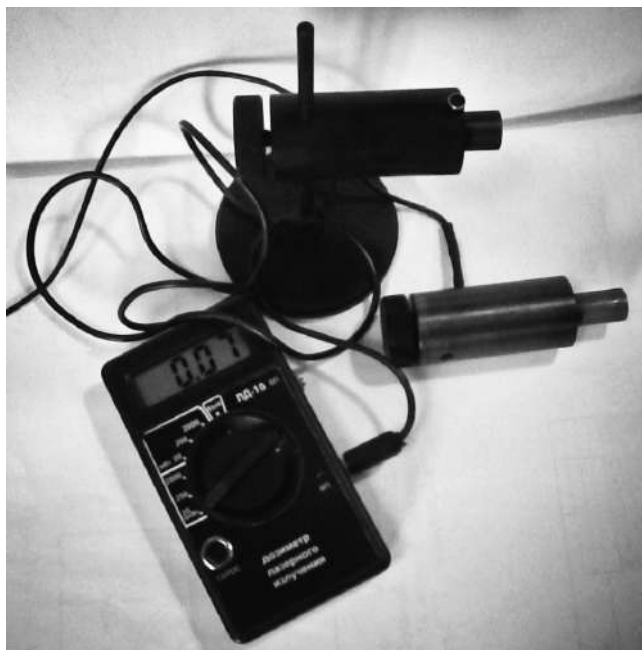
Рис. 1. Макет дозиметра лазерного випромінювання

приклад, Санітарні правила і норми 2.2.4.13–2–2006 “Лазерне випромінювання та гігієнічні вимоги при експлуатації лазерних виробів”, прийняті на території Республіки Білорусь [9] або в інших європейських країнах [10].