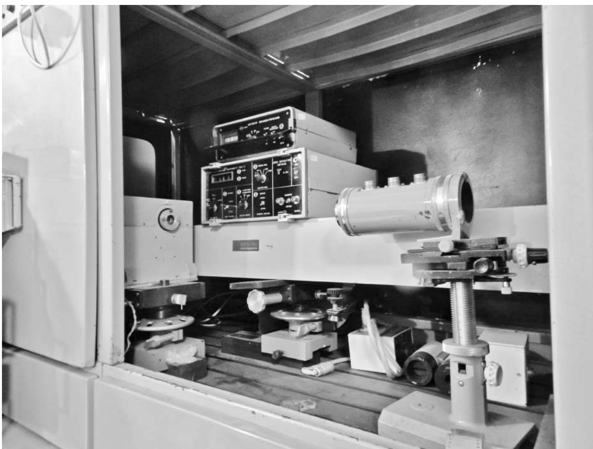
Рис. 4. Установка для повірки дозиметрів лазерного випромінювання на довжинах хвиль 10,6 і 1,06 мкм